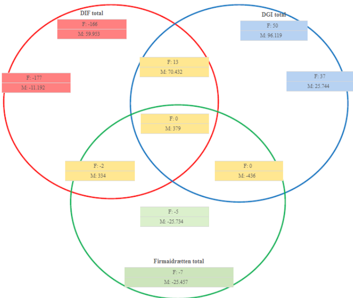
Figur 2 – Udvikling i overlappet mellem idrættens hovedorganisationer, foreninger og medlemmer, 2022-2023

Det ses også, at antallet af foreninger og medlemmer under DIF alene er gået tilbage med henholdsvis 177 foreninger og 11.192 medlemmer. Dermed er den samlede medlemsvækst i DIF på 59.953 medlemmer primært sket i foreninger, som også er organiseret i DGI.