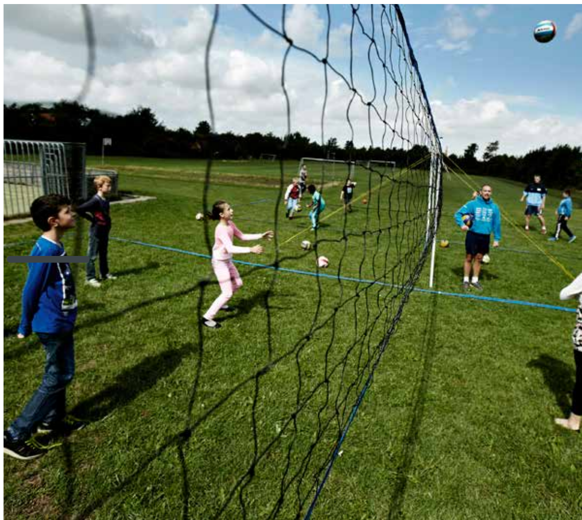
'Volley i Skolen' på Nymarksskolen i Slagelse.

DBU og lokalunionerne ønsker – ved hjælp af flere projekter – at vise, hvilken effekt fodbold har på indlæring, og hvilke positive sundhedsmæssige perspektiver fod-