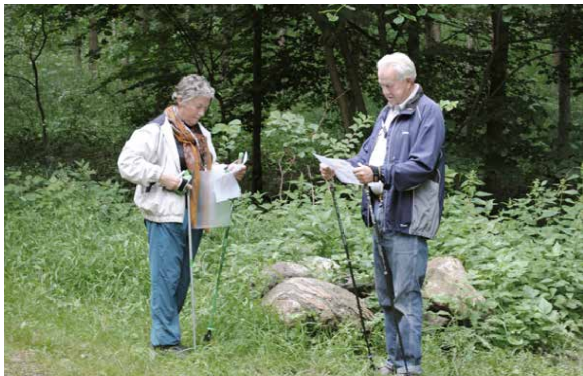
Folk i alle aldre kan deltage i DIF og orienteringsforbundets udviklingsprojekt 'Find vej i Danmark'.

Selvom de ikke helt nåede deres målsætninger, var der også markant medlemsfremgang i udviklingsprojekterne hos badminton, tennis, golf og håndbold. Nogle af disse forbund har oplevet en tilbagegang i deres CFR-medlemstal i samme periode, men i evalueringen skønnes det, at udviklingsprojekterne har været med til at dæmpe medlemsnedgangen, og at de på sigt måske kan være med til at vende den samlede medlemsudvikling.