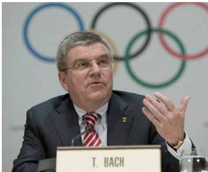
IOC-præsident Thomas Bach.

Uddannelsen er et vigtigt element i en langsigtet international strategi, der skal få flere nordiske kandidater valgt til internationale idrætsorganisationer – og dermed styrke de nordiske landes mulighed for at påvirke disse organisationers politik.