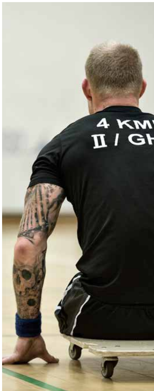
DIF Soldaterprojekt skaber idrætsmuligheder for sårede soldater.