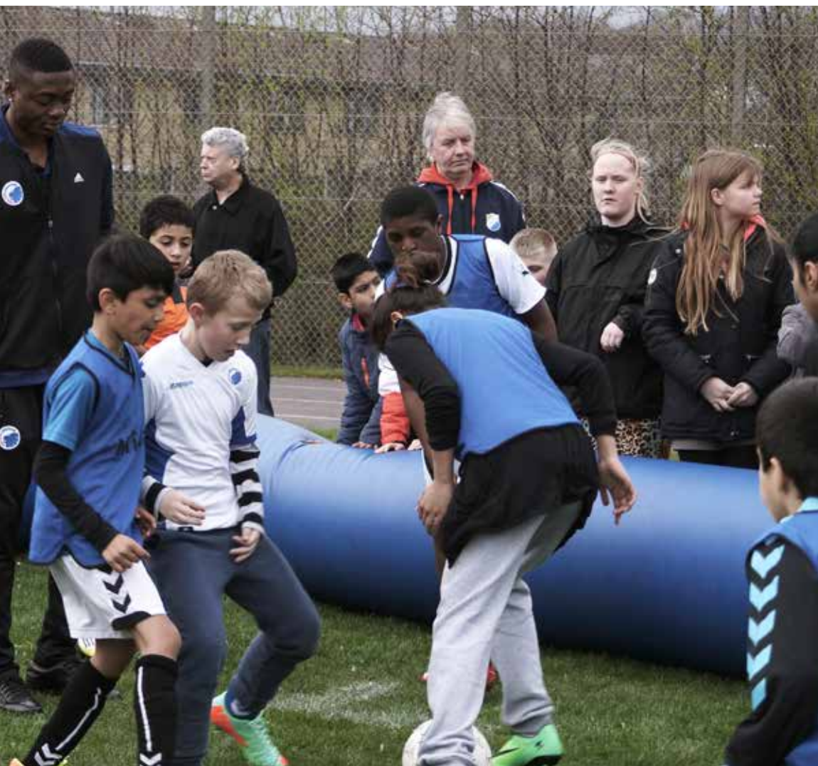
DIF Get2sport i Høje-Taastrup