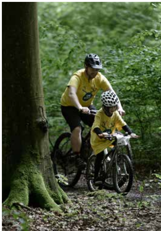
Kampagnen 'Flink af natur' blev skudt i gang i Geel Skov.

I 2014 fik DIF i samarbejde med Sport Event Denmark indført grønne kapitler i eventorganisationens eventguide. Det betyder, at alle arrangører af store internationale idrætsarrangementer i Danmark nu har en værktøjskasse til at afholde grønnere og mere bæredygtige arrangementer. I 2015 vil man således se flere grønne tiltag ved fx kano- og kajakforbundets world cup, hvor et kreativt initiativ er en vandbar, som miljøministeren åbner. Læs mere på www.sportevendenmark.com .