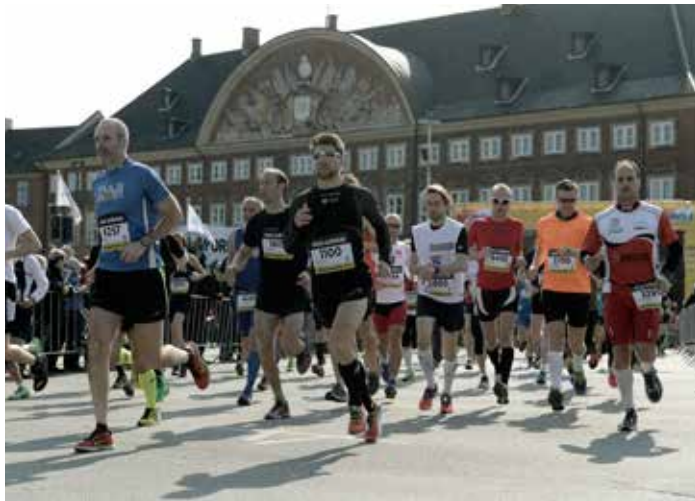
Sport Event Denmark var med til at skaffe VM i halvmaraton til København.

I foråret 2014 offentliggjorde Kulturministeriet den udredning om idrættens struktur og finansiering, som blev skrevet ind i bemærkningerne til den nye spillelov tilbage i 2010. Og kort efter landede kulturminister Marianne Jelved en stemmeaftale om dansk idræt, som samtlige partier i Folketinget bakkede op.