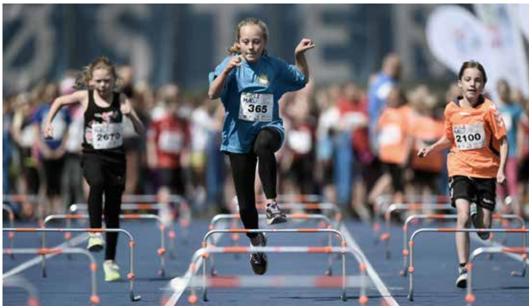
Skole OL-finale på Østerbro Stadion.

Med folkeskolereformens indtog i 2014 fulgte der spændende udfordringer med at udfylde børnenes idrætstimer med kvalitet – blandt andet via samarbejder mellem skoler og foreningsliv. I det spændingsfelt kommer Skole OL for alvor til sin ret.