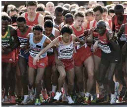
30.000 løbere deltog i VM i halvmaraton i Københavns gader.

afviklingen af to andre store idrætsbegivenheder i 2014: Made in Denmark (golf) og VM i badminton.