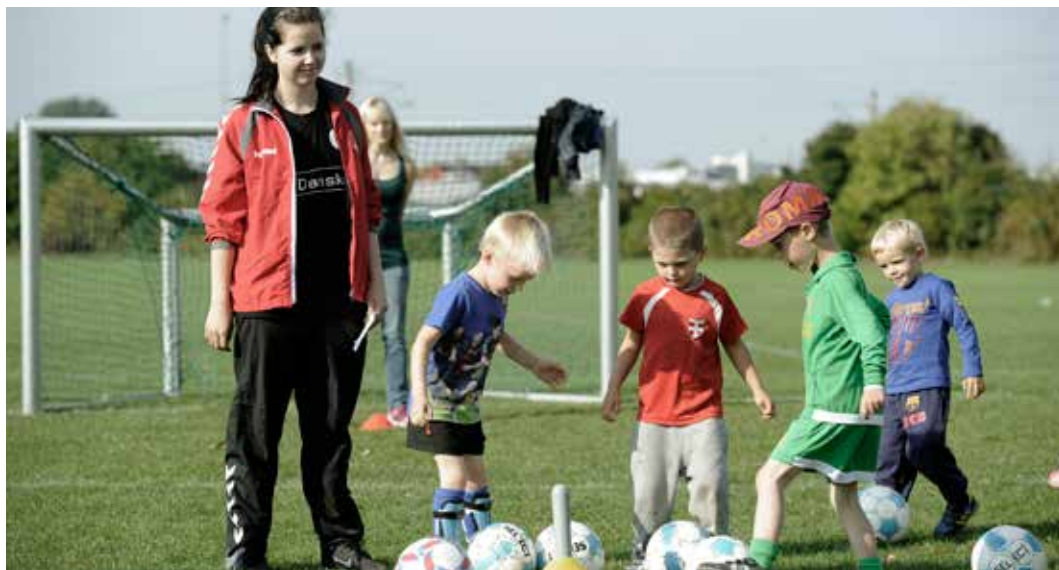
Frivillige i Fremad Valby

Det er målet, at alle DIF's 61 specialforbund skal have en frivillighedsstrategi. For at sætte skub i processen, søsatte DIF i 2014 et procesforløb for de specialforbund, der ønsker støtte og vejledning til at formulere frivillighedsstrategien.